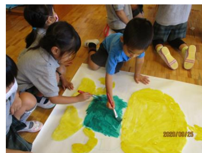
みらいちゃんの壁面づくり