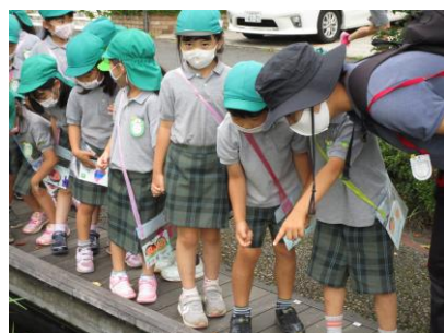
せせらぎでの散策

さて、全園児が一斉に登園できるようになって早1ヶ月が経ちました。友達同士の関わりが増えたことで、子ども達の小さな社会にも大きな変化が生まれ、遊びもかなり活発になりました。好きなことを見つけて喜んで遊んでいる子、1つの遊びにとことん拘り夢中になって遊んでいる子、仲の良い友達と会話をしたり遊びを共有したり工夫したりして楽しんでいる子、上のクラスのお友達の遊びに憧れ、一生懸命挑戦する子など、たくさんの場面で、成長している様子が感じとれます。時に自分の思いが通らず泣いたり、落ち込んだり、相手を罵倒してしまうなどの心の葛藤もありますが、自ら環境に関わり何かに気づき、そして感じ、考えて行動し、普段の生活や遊びを体験することで、集団生活のきまりや人間関係の大切さを学んでいるようでとても嬉しく思います。特に遊びは、友達と伝え合い分かり合う喜びを得ることで、人への信頼感、思いやり、尊重する気持ちが芽生え人と生きる術を学びます。この機に大いに遊び、たくさんの経験をして欲しいと思います。また、10月10日に予定している運動会は、友達と力を合わせ心を1つにして達成感を味わうことを目的にしています。今年は、コロナ感染予防のため、残念ながら乳児組と年少組は行いませんが、年中組は親子で体を動かして楽しんでいただき、年長組は、友達同士意見を出し合い自分たちで作り上げる運動会にしようと日々準備を行っています。この時期は、子ども達が、それぞれの力をステップアップする大切な時期ですので、私たち保育者も個々の興味・関心に気づき、“やってみよう”という気持ちを十分に満足させ、常に保育を振り返り、園児一人一人の成長をバックアップしていきたいと思っています。